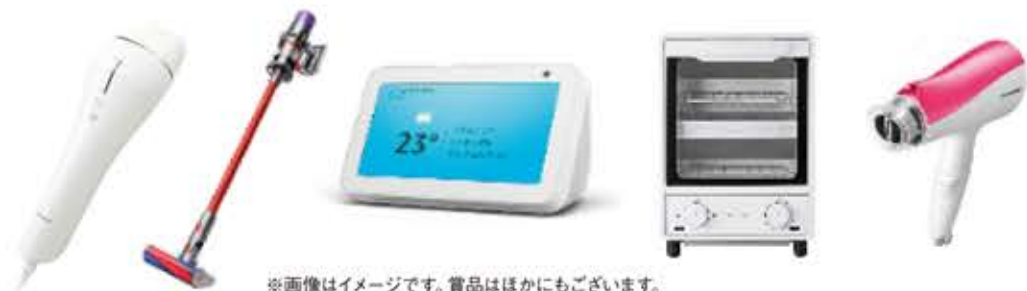
※画像はイメージです。賞品はほかにもございます。