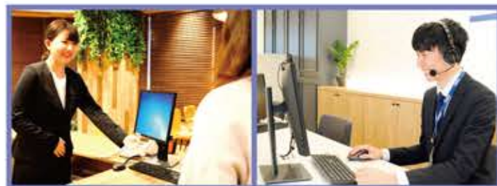
来店またはオンラインでお部屋を探した方が抽選にご参加いただけます！