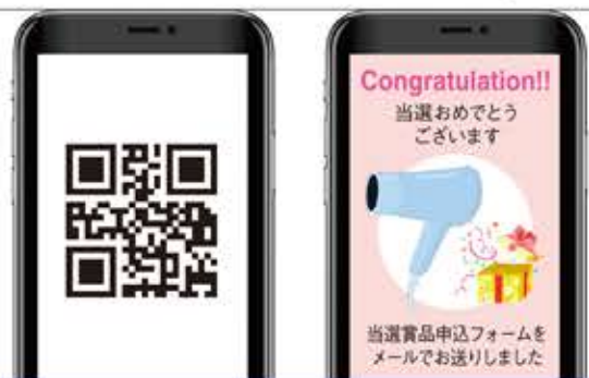
QRコードからキャンペーン参加 ▶ 当たりが出たら家電プレゼント

なります。こちらにも予約情報は店舗の基幹システムであるAOSに自動登録されます。他にも、店舗駐車場の地図表示追加、前回の条件で探す機能追加、アプリ地図検索機能追加など、お客様の利便性をアップできるサービスはないか、常に社内検討しております。お部屋探しならアパマンショップと違って頂けるよう、キャンペーンや利便性の高いシステム、質の高いスタッフ研修や、コンプライアンスの徹底など、お客様、オーナー様には選ばれるアパマンショップを目指して参ります。